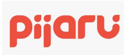
Gambar 2.1. Logo Pijaru