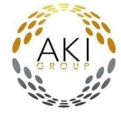
Gambar 2 1 Logo PT Anugerah Kasih Investama