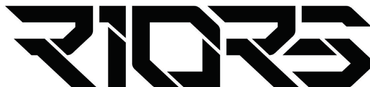
Gambar 2.1. Logo RIORIS

Berdasarkan Company Profile perusahaan, RIORIS memiliki visi yaitu “ Create experience that moves people ” dan untuk memenuhi visi itu, RIORIS menjalankannya dengan misi “ Invent the best quality products, with the best service and experience in a sustainable way. ” (hlm. 7)