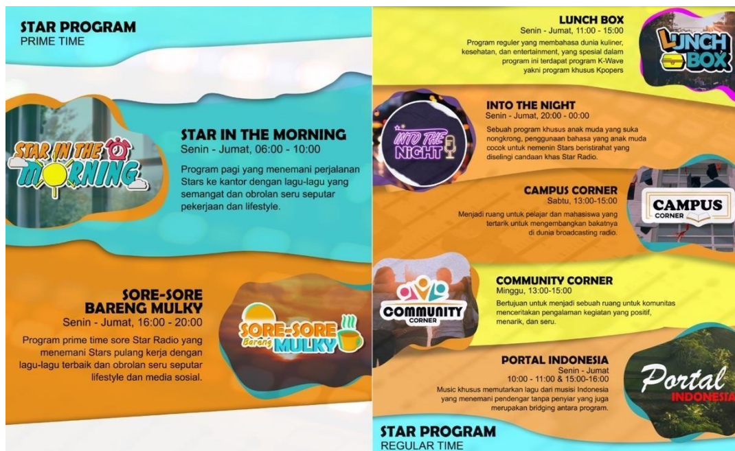
Gambar 2. 2. Program-Program On Air di Star Radio

Star Radio selalu memberikan program-program yang menarik dengan kualitas terbaik, berikut adalah program-program weekdays dan weekend :