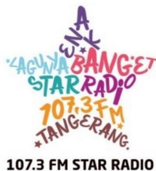
Gambar 2. 1. Logo Baru Star Radio