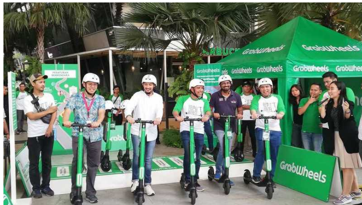
Gambar 2.2 Launching GrabWheels di The Breeze BSD

periklan, public relations , dan digital. Ogilvy & Mather Indonesia sudah menangani banyak brand terkemuka di Indonesia. Ogilvy & Mather pernah mengerjakan iklan untuk Pond's, Dove, Sambal ABC dan juga Coca-cola. Untuk kegiatan public relations yang pernah ditangani oleh Ogilvy Public Relations antara lain product launching Rexona Dry Serum Natural Whitening, launching GrabWheels di The Breeze BSD, launching produk Japota dari CalbeeWings dan masih banyak lainnya. Sedangkan proyek digital yang pernah dikerjakan oleh Ogilvy & Mather Indonesia adalah untuk Tinder SEA.