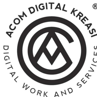
Gambar 2.1 Logo Acom Digital Kreasi