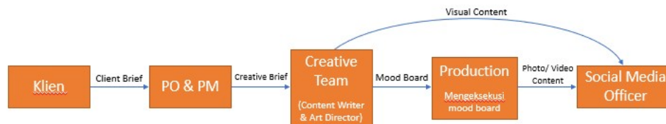
Gambar 2.4 Alur Kerja dengan Divisi Terkait

Bertanggung jawab untuk menjadi penghubung antara divisi Kreatif dengan klien, memahami dan menyediakan kebutuhan klien, memproduksi rancangan komunikasi, menyusun laporan kuartal, menyediakan mekanisme untuk digital activation , mengawasi performa media sosial klien, serta menyediakan KOL ( Key Opinion Leader ), influencer , dan buzzer .