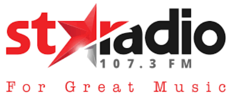
Gambar 2.1. Logo Baru StarRadio

Star Radio adalah perusahaan yang bergerak di bidang media komunikasi. Berdiri pada tanggal 11 Maret 1990, dulunya bertempat di Pasar Kemis dengan frekuensi 106.5 FM. Lalu Star Radio pindah lokasi ke perumahan Modern Land di Kota Tangerang, Banten lalu mengganti frekuensi menjadi 107.3 FM.