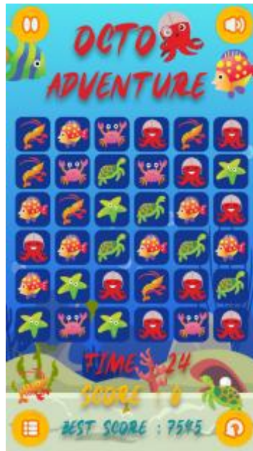
Gambar 2. 7 Asset Game OCTO Vending Machine CIMB Niaga

makanan di Vending machine bisa digunakan sebagai games OCTO untuk mendapatkan hadiah yang ditampilkan acara ulang tahun 65 Tahun CIMB Niaga, untuk mempromosikan dan membuat games tersebut menggunakan format motion graphics .