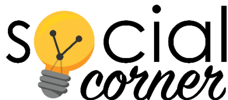
Gambar 2. 2 Social Corner

PT. Integrasi Media Komunika (Design Corner Jakarta) adalah sebuah agency kecil yang berdomisili di Jl. Kostrad Raya, Petukangan Utara, Kota Jakarta Selatan, yang berfokus pada produksi Digital Creative Content , Studio Photography, dan perusahaan ini telah memproduksi video, animasi dan desain untuk klien-klien dari Bank CIMB Niaga. Perusahaan tersebut sudah berdiri sejak tahun 2015 dengan berawal hanya ada tiga karyawan yang berteman dari salah satu kampus di Tangerang Selatan, setelah mereka publikasi mencari karyawan di media sosial. Design corner menjadi bertambah untuk karyawan di tahun 2020 menjadi enam belas orang untuk bekerja di agency Design Corner.