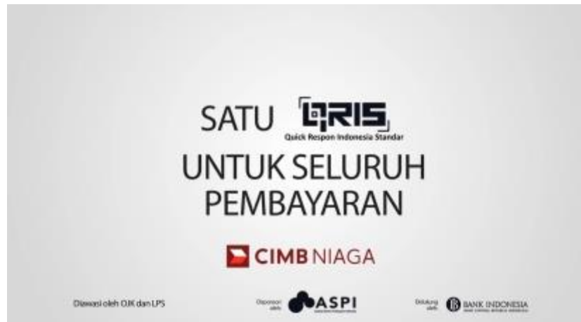
Gambar 2. 5 Video EDC Cim Niaga

kartu dan bisa digunakan untuk QRIS dari aplikasi OCTO Mobile. Video EDC ini berdurasi satu menit dengan format motion graphics . Untuk video tutorial berikutnya dari Bank CIMB Niaga adalah project untuk video tutorial OCTO Clicks yang menjelaskan berbagai macam sistem dan layanan melalui website terbarunya octoclicks.co.id