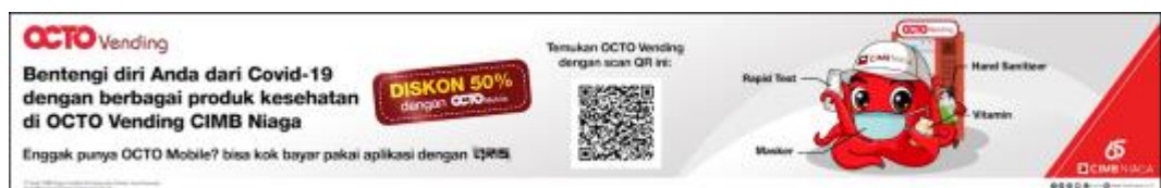
Gambar 2. 6 Video LED Payday CIMB Niaga

Selain video EDC ada video animasi untuk Led Stretch promosi dari Bank CIMB Niaga yang akan ditampilkan dalam email blast, mesin ATM, dan LED di gedung atau mall. Bertujuan untuk memberikan info bahwa ada promo atau informasi dari Bank CIMB Niaga beberapa program untuk keperluan dalam kehidupan nasabah.