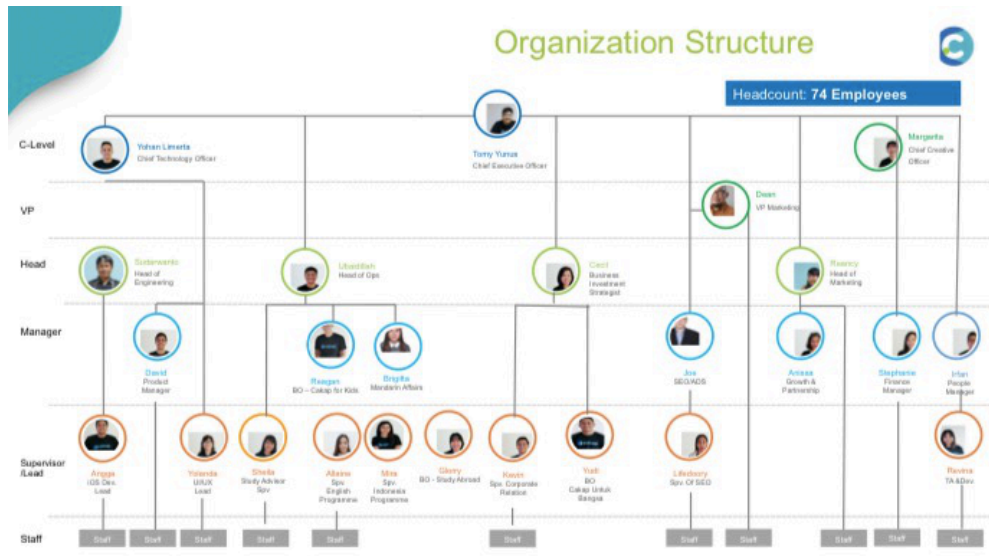
Gambar 2.6 Struktur Organisasi PT Cerdas Digital Nusantara