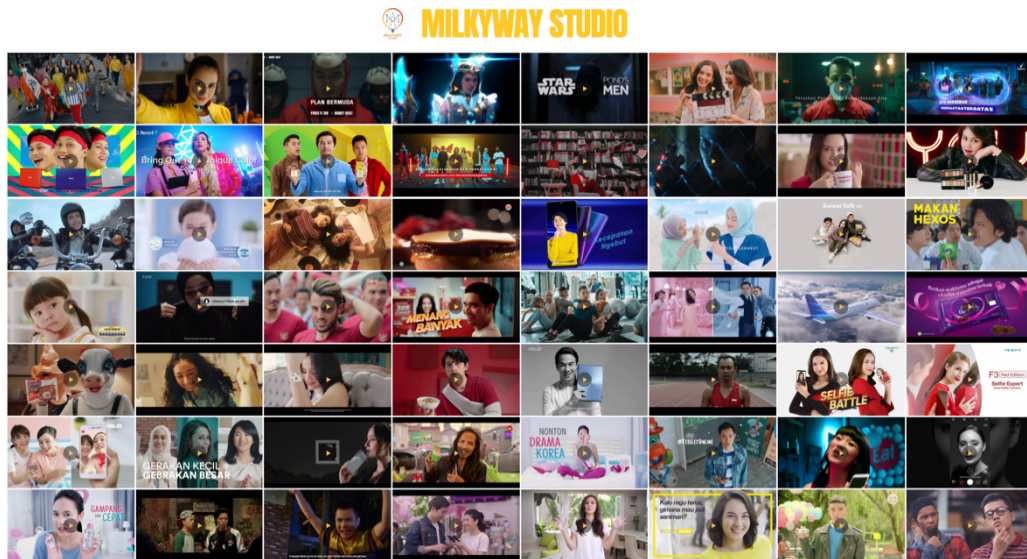
Gambar 2.2 Beberapa Hasil Karya Milkyway Studio

dari Milkyway Studio merasakan kepuasan atas karya-karya dari Milkyway Studio. Dengan production value dan kepuasan klien, membuat Milkyway Studio dapat melebarkan sayap dari mulut ke mulut, sehingga Milkyway Studio dapat bertahan hingga saat ini.