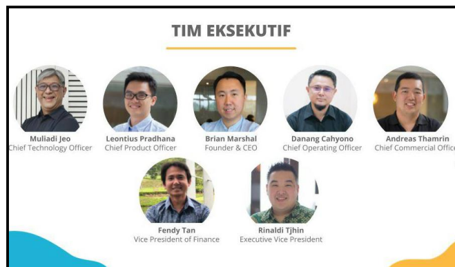
Gambar 2.10 Executive Team SIRCLO (SIRCLO, 2020)

SIRCLO terbagi menjadi beberapa divisi, yaitu Divisi Technology , Divisi People Operations , Divisi Marketing , Divisi Finance, Tax, Accounting & Legal dan Divisi Executive Office & Special Projects . Penjelasan akan lebih mendalam pada divisi Technology dimana kerja magang dilakukan.