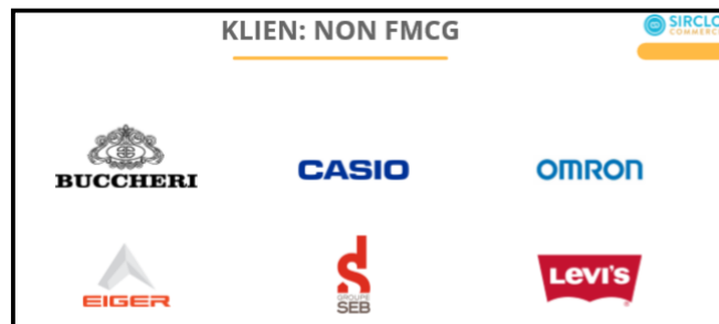
Gambar 2.6 Client Non FMCG SIRCLO Commerce

Pada PT. Koneksi Niaga Solusindo juga terdapat 2 produk yang telah dibangun dan dikembangkan hingga saat ini, antara lain: