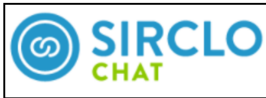
Gambar 2.8 Logo SIRCLO Chat

Hubungan penjual dan pelanggan merupakan hal yang sangat berharga dalam berbisnis. Hal ini yang menjadi pondasi awal berdirinya SIRCLO Chat pada awal tahun 2020, yang merupakan partner resmi Business Solution Provider WhatsApp yang menyediakan chat commerce dalam sebuah dashboard yang terintegrasi dengan WhatsApp Business API .