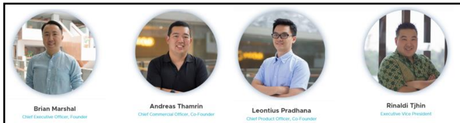
Gambar 2.9 Executive Team SIRCLO (SIRCLO, 2020)

Seiring berjalannya waktu, SIRCLO menjalin kerja sama dengan berbagai perusahaan. Tim eksekutif SIRCLO pun bertambah 3 orang, antara lain: