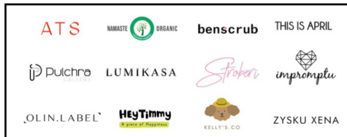
Gambar 2.3 Client SIRCLO Store

SIRCLO Store merupakan produk pertama SIRCLO dengan memanfaatkan platform Software-as-a-Service (SaaS) untuk membuat situs toko online yang menyasar bisnis lokal skala kecil hingga menengah, menyediakan jasa pembuatan website toko online berbasis template siap pakai. Produk ini memberikan solusi bagi brand untuk memiliki situs brand.com resmi yang memfasilitasi pelanggan bertransaksi online .