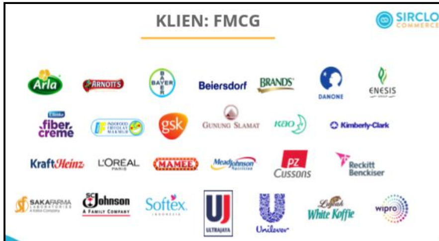
Gambar 2.5 Client FMCG SIRCLO Commerce

online dengan memanfaatkan teknologi yang memberikan pelayanan end-to-end kepada brand , dari produksi konten, mensinkronisasi penjualan di berbagai marketplace , hingga proses logistic dan merchandising .