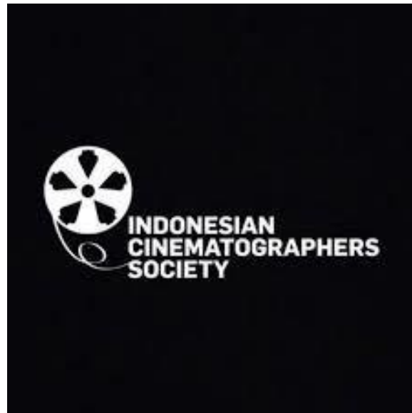
Gambar 2.1. Logo Indonesia Cinematographer Society