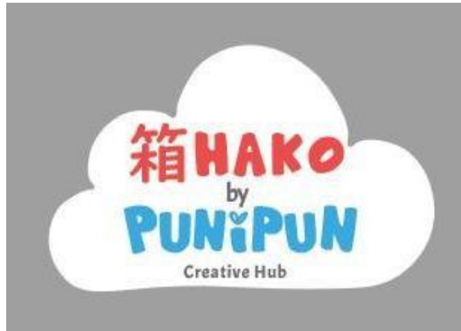
Gambar 2. 2 Logo HAKO Studio