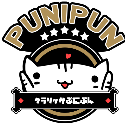
Gambar 2. 1 Logo Punipun

Gambar 2.1 merupakan logo dari Punipun. Brand ‘Punipun’ mempunyai logo berbentuk kucing, logo ini di desain atas keinginan Clarissa selaku pemilik brand. Clarissa menginginkan logo yang mudah untuk digunakan diberbagai jenis ataupun bentuk produk yang diproduksi dibawah nama ‘Punipun’. Selain itu, pemilihan kucing karena hewan ini lucu, universal , dan versatile atau mudah digunakan.