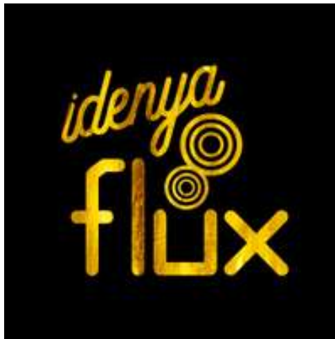
Gambar 2.2. Logo Idenya Flux

Idenya Flux memiliki visi untuk menjadi creative agency yang sangat berharga dan bersinar seperti emas. Visi tersebut dibantu oleh misi yang dimana Idenya Flux akan selalu memberikan ide emas dan mengubah setiap tujuan klien menjadi emas yang berharga. Selain itu nama Flux sendiri memiliki arti continuous improvement to be the best . Karena itu maka Flux dijadikan nama perusahaan karena perusahaan ini akan terus menuju perubahan ke arah yang lebih baik.