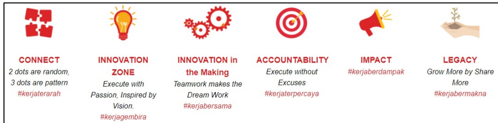
Gambar 2.3 Nilai PT Putera Handal Indotama (PHI-Integration, 2018)

Dengan memahami bahwa setiap pekerjaan membawa dampaknya masing-masing terhadap banyak individu menjadikan setiap pekerjaan yang dilakukan menjadi bermakna.