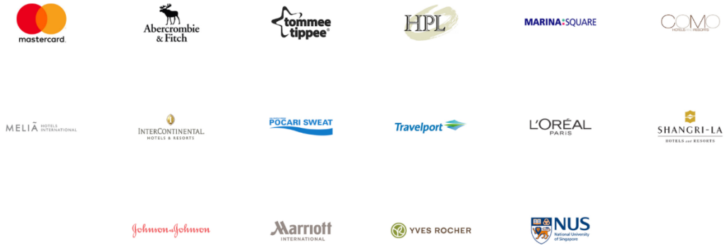
Gambar 2.2 Klien perusahaan