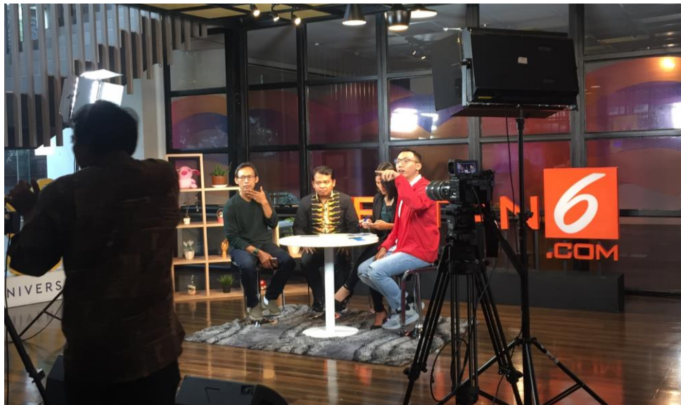
Gambar 3.6 Contoh Live Streaming Dear Netizen Episode “KPAI-PB Djarum Berdamai, Audisi Bulu Tangkis Lanjut Lagi?”

Tugas rutin mingguan penulis adalah Live Streaming Dear Netizen yang dilakukan setiap hari jumat dengan topik trending utama dalam satu minggu terakhir. Dalam Live Streaming Dear Netizen , penulis bertugas untuk menyediakan properti hiasan untuk mempercantik inframe saat live streaming berupa hiasan seperti bunga, tanaman, piala, piagam, dan lain sebagainya. Serta menjadi time keeper yang diarahkan oleh Koordinator Live Streaming . Live streaming video adalah istilah yang diterapkan pada teknologi kompresi dan buffering yang mengirim video secara real time melalui internet sehingga pengguna dapat menonton (Bhatnager, Mehta, & Mitra, 2001, p. 119).