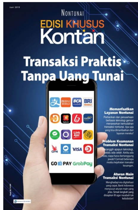
Gambar 2.4 Tampilan Edisi Khusus Kontan