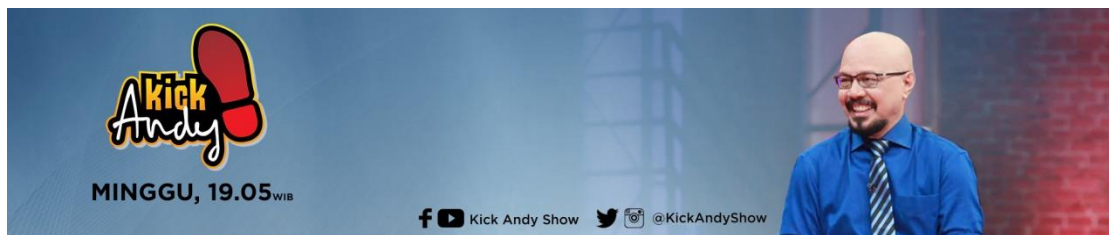
Gambar 2.2 Online Banner Program Kick Andy

Program Kick Andy , salah satu program yang format talkshow inspirasi yang dibawakan oleh seorang host yang membahas topik seputar masalah sosial, kesehatan, budaya, dan sebagainya dengan mengundang narasumber yang dianggap inspiratif dan relevan dengan topik yang sedang dibahas. Program ini merupakan program taping yang memiliki 6 segmen per episodenya, dan proses produksi program ini biasa dilakukan sehari sebelum jadwal tayangnya. Program Kick Andy ini juga memiliki program spesial tiap tahunnya dalam rangka HUT program yang dinamakan Kick Andy Heroes , yang merupakan acara malam penganugerahan untuk para tamu inspiratif yang dinilai inspiratif dan membuat perubahan yang nyata terhadap isu-isu tertentu.