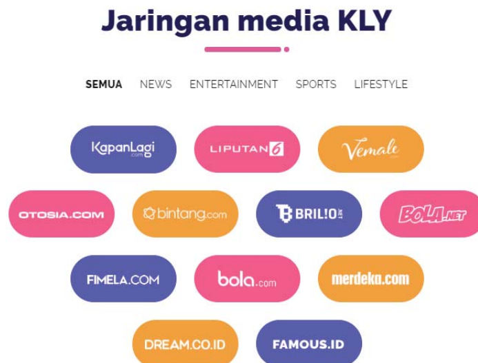
Gambar 2.3 Jaringan Media KLY