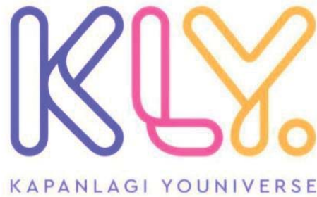
Gambar 2.2 Logo KLY