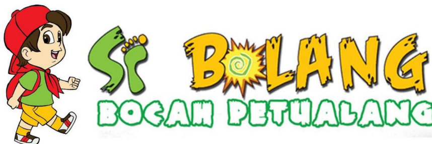
Gambar 2.3 Logo program Si Bocah Petualang