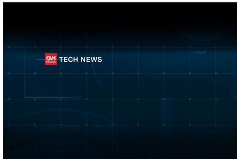
Gambar 2.4 CNN Tech News