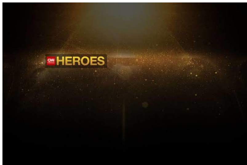
Gambar 2.3 CNN Indonesia Heroes