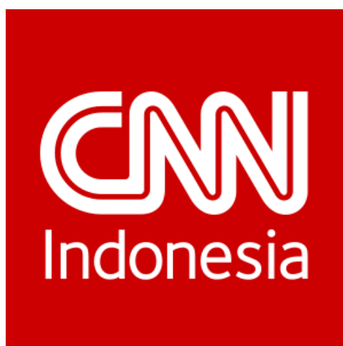
Gambar 03: Logo Media CNNIndonesia.com

Sebagaimana yang tercantum dalam halaman about us dari laman CNNIndonesia.com, berikut adalah visi dan misi perusahaan media tempat penulis menjalankan praktik kerja magang: