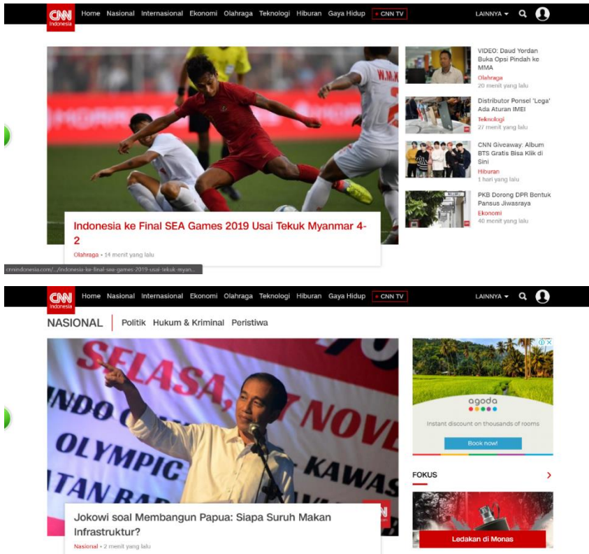
Gambar 01: Tampilan Desktop Halaman Utama dan Halaman Kanal Nasional CNNIndonesia.com