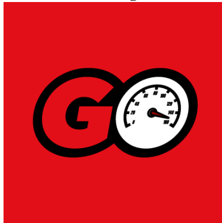
Gambar 2.2 Logo GridOto

GridOto menyuguhkan berita otomotif secara lugas, aktual, dalam, dan mudah dimengerti. Berita yang disajikan berupa berita peristiwa event mengenai otomotif baik di dalam maupun luar negeri, seperti Indonesia Interational Motor Show, Gaiikindo, dll, bisnis, produk baru, harga, kendaraan bekas, pembiayaan, asuransi, komunitas, gaya hidup, modifikasi, hingga figur otomotif. GridOto juga menyajikan ulasan berupa pengetesan mobil (test drive) dan motor baru (test ride) serta tips and tricks. Karya kreatif tidak hanya disajikan lewat angle tulisan tajam-ringan, namun juga lewat multiplatform berupa grafis dan video kaya informasi serta menghibur (Gridoto, n.d., p. 13). Gridoto sendiri memiliki beberapa anak media lagi yang berada dibawah naungan divisi Gridoto seperti Motorplus, Otomotifnet.com, Jip.grid.id, otoseken.id, otorace.id, serta otomania.com.