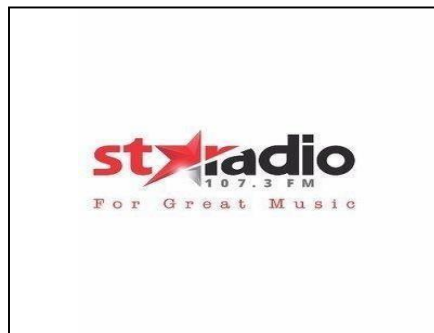
Gambar 2.1 Logo Star Radio