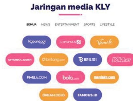
Gambar 2.2 Jaringan Media KLY

Selain Liputan6.com, Kapanlagi Youniverse (KLY) sebagai jaringan media online terbesar di Indonesia memiliki segmentasi terlengkap dengan beberapa media. Media yang berada pada jaringan Kapanlagi Youniverse (KLY) selain Liputan 6.com yaitu, Kapanlagi.com, Vemale, Otosia.com, Bintang.com Brilio.com, Bola.net, Fimela.com, Bola.com, Merdeka.com, Dream.co.id, dan Famous.id.