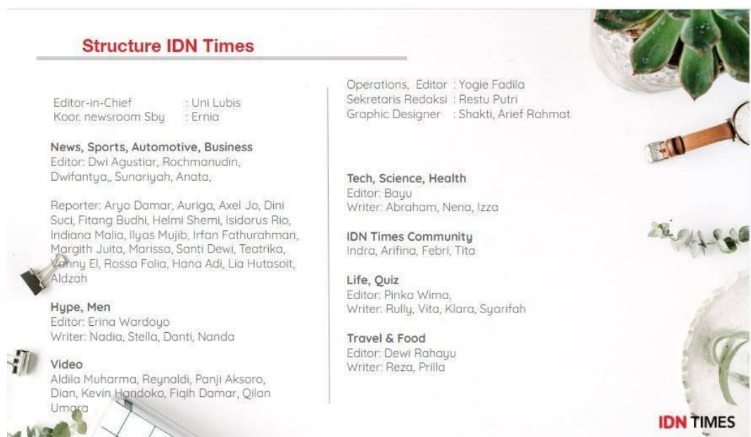
Gambar 2.3 Susunan Redaksi IDN Times