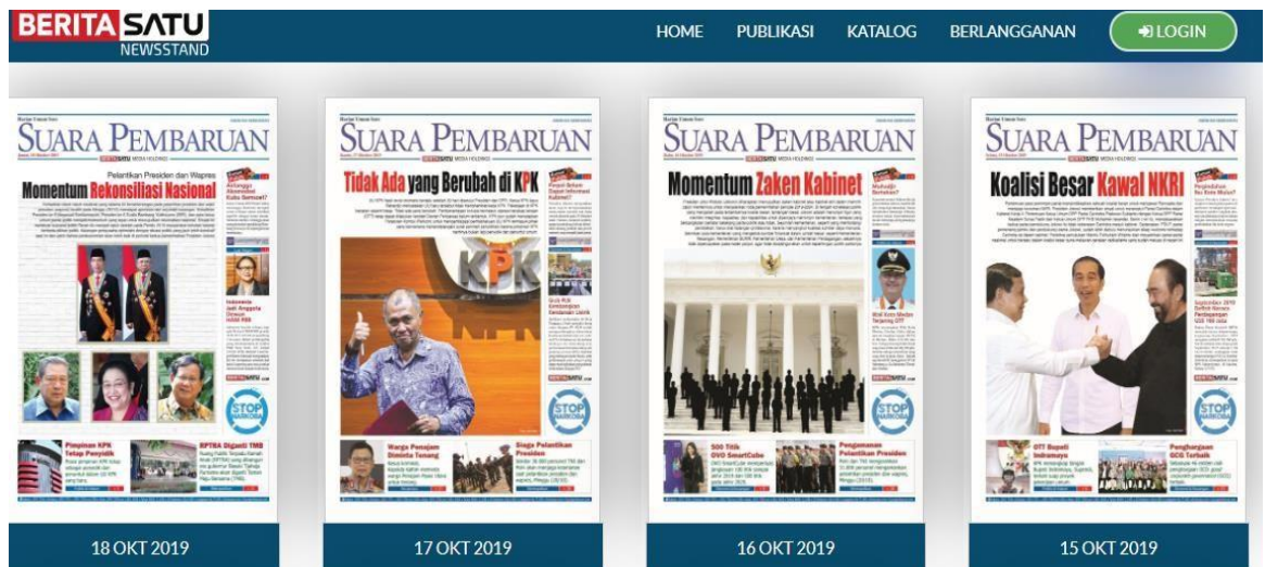
Gambar 2.3 Tampilan Depan Epaper Suara Pembaruan