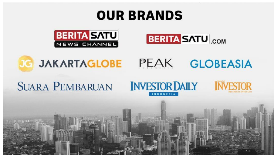
Gambar 2.1 Berita Satu Media

Untuk mendukung perkembangan teknologi dan informasi, Suara Pembaruan tidak hanya terbit dalam versi cetak. Berdasarkan informasi yang penulis himpun dari sekretariat redaksi, tahun 2001 Suara Pembaruan meluncurkan portal berita dengan konten yang tidak berdeda jauh dengan versi cetak.