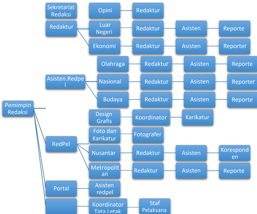
Bagan 2.3 Struktur Redaksi Suara Pembaruan