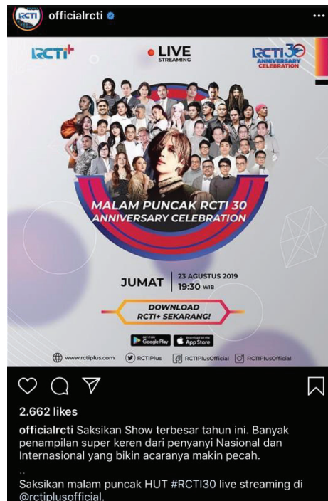
Gambar 3.1 Informasi mengenai bintang tamu HUT RCTI ke-30

disiarkan oleh penyiar di setiap program siaran yang Star Radio selama siaran berlangsung.