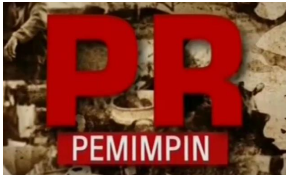
Gambar 2.9 Logo PR Pemimpin