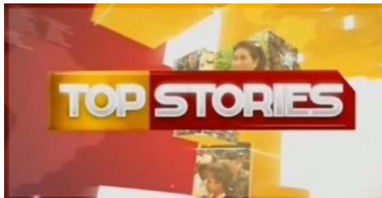
Gambar 2.6 Logo Top Stories