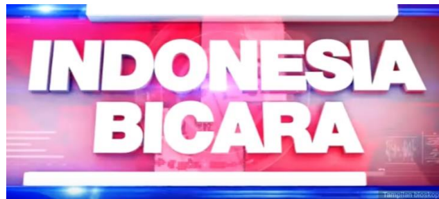
Gambar 2.3 Logo Indonesia Bicara