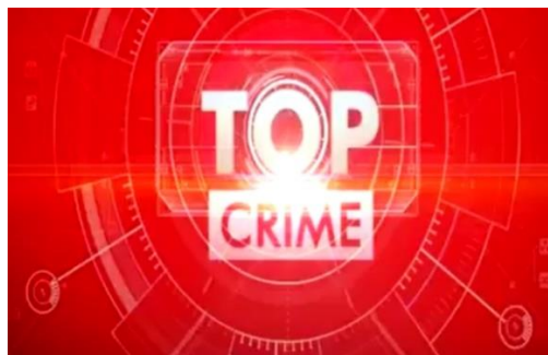
Gambar 2.8 Logo Top Crime

Top Crime merupakan sebuah program berdurasi tiga puluh menit memberikan informasi kriminal yang terjadi di Indonesia. Program ini hadir satu kali seminggu dan tayang pada hari Minggu.