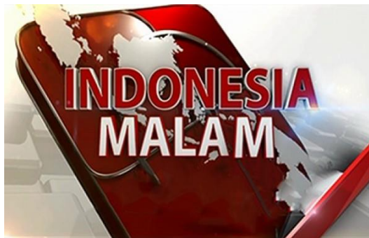
Gambar 2.5 Logo Indonesia Malam