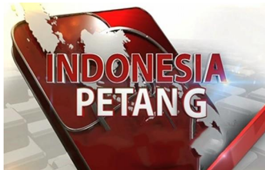
Gambar 2.4 Logo Indonesia Petang