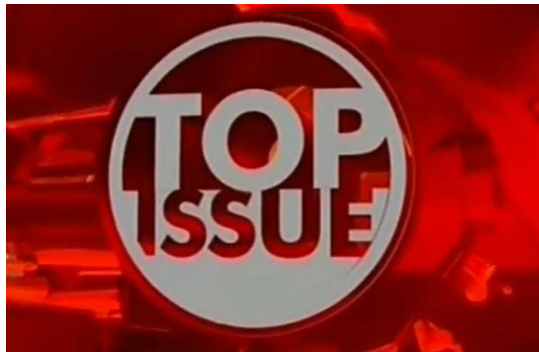
Gambar 2.7 Logo Top Issue