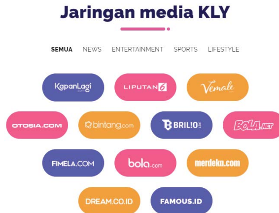
Gambar 2.2 Jaringan Media Kapan Lagi Youniverse