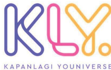
Gambar 2.1 Logo Perusahaan Kapan Lagi Youniverse

Liputan6.com merupakan media online yang berada di bawah naungan Kapan Lagi Youniverse (KLY), yaitu sebuah perusahaan media online antara PT Kreatif Media Karya (KMK) dan Kapan Lagi Networks (KLN) ( Public Relation , 2019, para. 2).