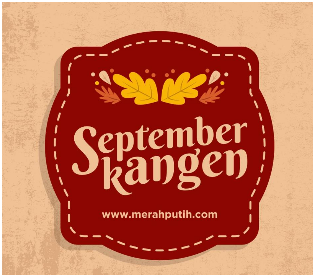
Gambar 3.2 Tema yang ada dibulan September

Pada media merahputih.com terdapat penugasan berupa tema yang ada pada setiap bulan. Pada tema yang telah ditentukan, setiap penulis akan membuat tulisan yang berhubungan dengan tema tersebut.