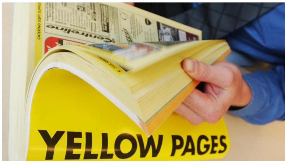
Yellow pages menghilang dalam bentuk fisik