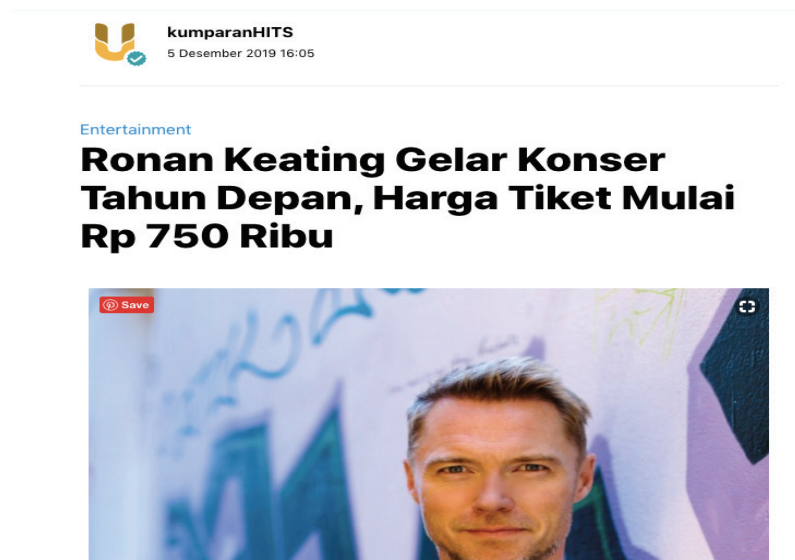
Gambar 2.2 Contoh Topik Kumparan Hits

Kumparan Hits berfokus pada berita-berita artis ibukota dan mancanegara yang mainstream terdengar oleh masyarakat Indonesia, seperti “Ronan Keating Gelar Konser Tahun Depan, Harga Tiket Mulai Rp 750 Ribu”, “Gisella Anastasia Batal ke Polda Gara-gara Ledakan di Monas”, dan lain sebagainya.