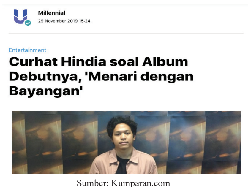
Gambar 2.6 Contoh Topik Kumparan Millennial

Sedangkan Kumparan Millennial, membahas segala sesuatu yang melibatkan generasi milenial dan dekat dengan kehidupan generasi milenial pada umumnya di Indonesia. Termasuk informasi-informasi yang viral di media sosial dan berhubungan dengan generasi milenial. Bahkan, Kumparan Milenial juga membahas sneakers-sneakers yang sedang hits atau tempat nongkrong asyik yang memang lagi digandrungi generasi milenial pada umumnya. Atau informasi-informasi trivia yang berguna bagi generasi milenial. Percintaan juga termasuk dalam topik yang bisa diangkat oleh reporter di Kumparan Millennial ini.