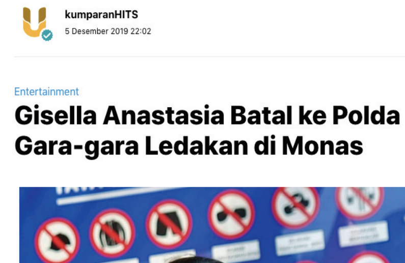
Gambar 2.3 Contoh Topik Kumparan Hits