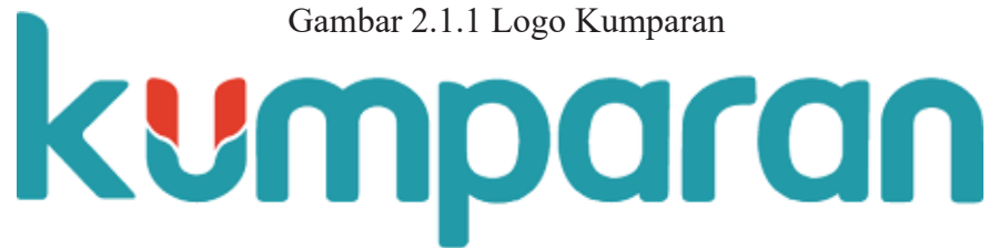
Gambar 2.1.1 Logo Kumparan