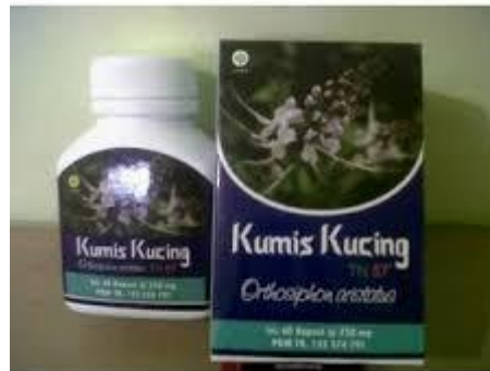
Gambar 2.6 Kumis kucing melancarkan buang air kecil.