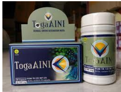
Gambar 2.5 Toga AINI memelihara kesehatan mata