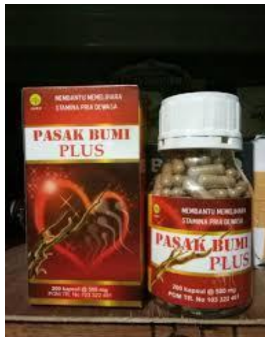
Gambar 2.2 Pasak Bumi Plus membantu memelihara stamina pria