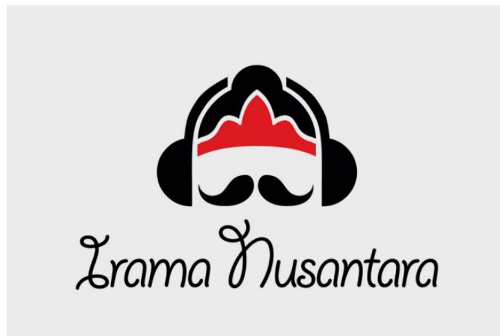
Gambar 2.1. Logo Yayasan Irama Nusantara

Irama Nusantara merupakan yayasan sosial kemasyarakatan yang berfokus pada pengarsipan, pelestarian, dan pendokumentasian musik populer Indonesia dari tahun 1950-an hingga sekarang. Inisiasi ini dilakukan berdasarkan kesadaran tentang betapa pentingnya mengenalkan kembali musik populer Indonesia yang telah ada kepada masyarakat Indonesia, yang mana adalah bagian dari identitas bangsa. Irama Nusantara juga turut mengajak masyarakat untuk ikut berpartisipasi dalam upaya pengarsipan ini. Sampai saat ini Irama Nusantara telah mengarsipkan lebih dari 3647 rilisan musik populer Indonesia dari berbagai label di Indonesia dari rentang tahun 1920-an hingga 1990-an, dan terdapat 2089 rilisan yang telah terunggah di situs web iramanusantara.org .