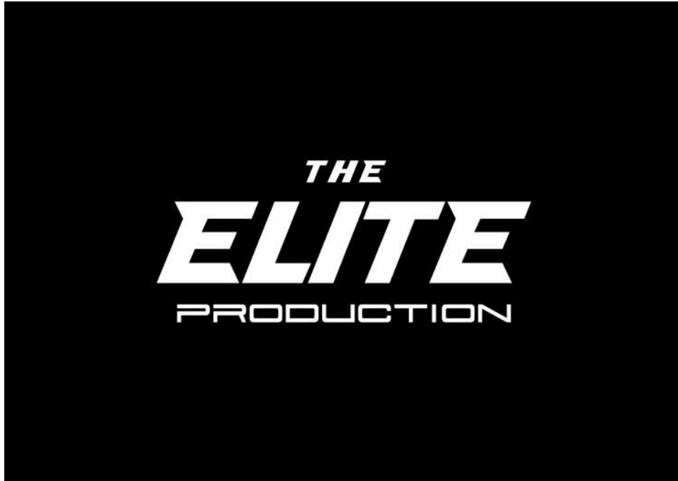
Gambar 2.4. Logo Perusahaan The Elite Production

Gambar diatas adalah logo The Elite Production yang dibuat pada tahun 2015. Konsep dari logo The Elite Production diatas adalah minimalis dan dinamis dikarenakan target yang dituju adalah kelas A dan AB yang dimana lebih suka dengan desain yang minimalis tidak banyak gambar yang lain.