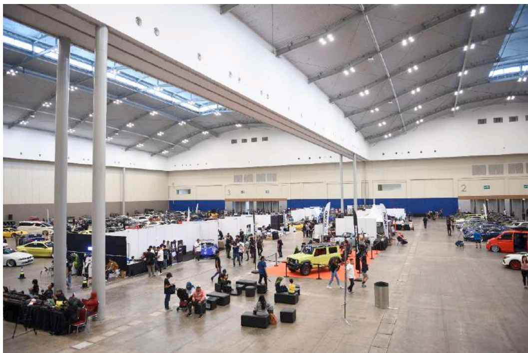
Gambar 2.2. Acara The Elite Showcase