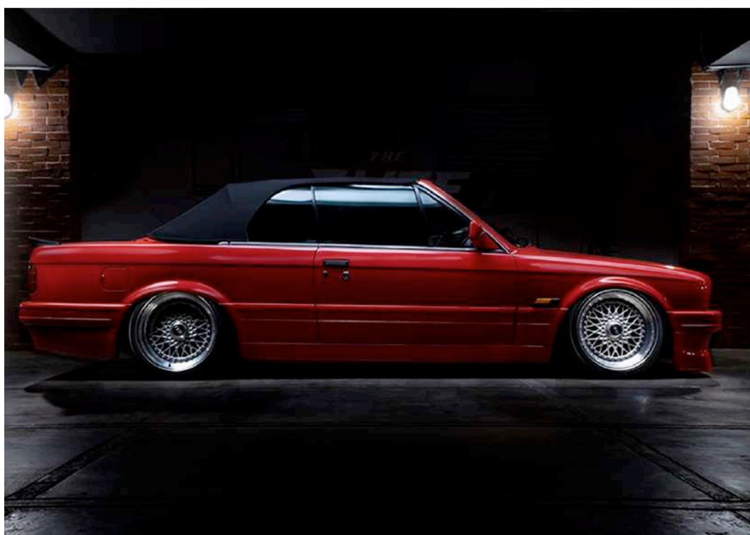
Gambar 2.3. Program The Elite Garage