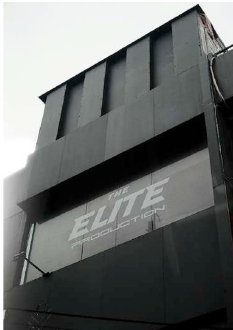
Gambar 2.1. Kantor The Elite Production

Gatot Mulyarto selaku vice president dari the elite production mendirikan the elite production pada tahun 2015. Awal mula terbentuknya The Elite Production berawal dari perkumpulan beberapa car enthusiast yang mempunyai visi dan misi sama untuk membuat industri otomotif Indonesia lebih maju lagi. Sebelumnya car enthusiast itu sendiri adalah para pecinta otomotif terutama pada kendaraan roda empat atau biasa dibilang dengan mobil. Dari beberapa orang car enthusiast dengan berbagai macam latar belakang dibidang otomotif dapat menyatukan visi dan misi mereka dengan membentuknya The Elite Production untuk membuat berbagai macam acara otomotif di Indonesia.