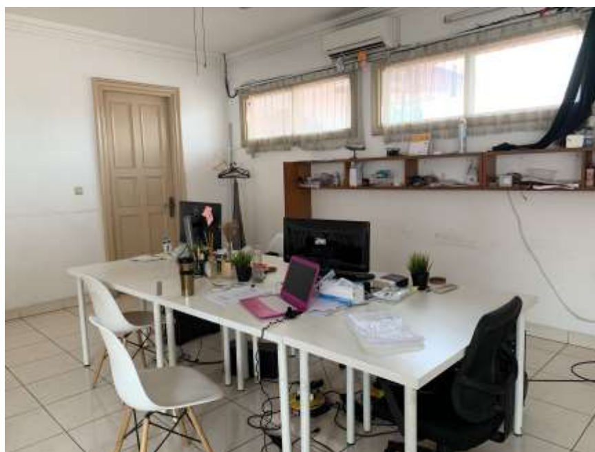
Gambar 2.3. Ruang kerja tim creative

Untuk perusahaan yang terhitung tidak terlalu besar, MAX Project kerap menggunakan jasa Outsourcing untuk pekerjaan yang spesifik seperti 3D Animation , dan pembuatan musik. Pembagian ruang kerja dibagi menjadi tiga ruangan utama yang diperuntukkan kepada masing-masing tim.