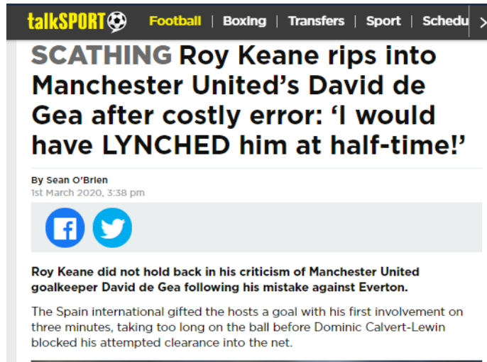
Gambar 3.4 Pemberitaan kritik Roy Keane di Talksport.com

Evaluasi informasi tentang topik tersebut penulis lakukan dengan membandingkan tiga berita yang berasal dari talksport.com pada Gambar 3.4, metro.co.uk pada Gambar 3.5, dan mirror.co.uk pada Gambar 3.6 yang menghasilkan kesamaan inti berita. Penulis dapat menyimpulkan dengan benar melalui proses evaluasi informasi.