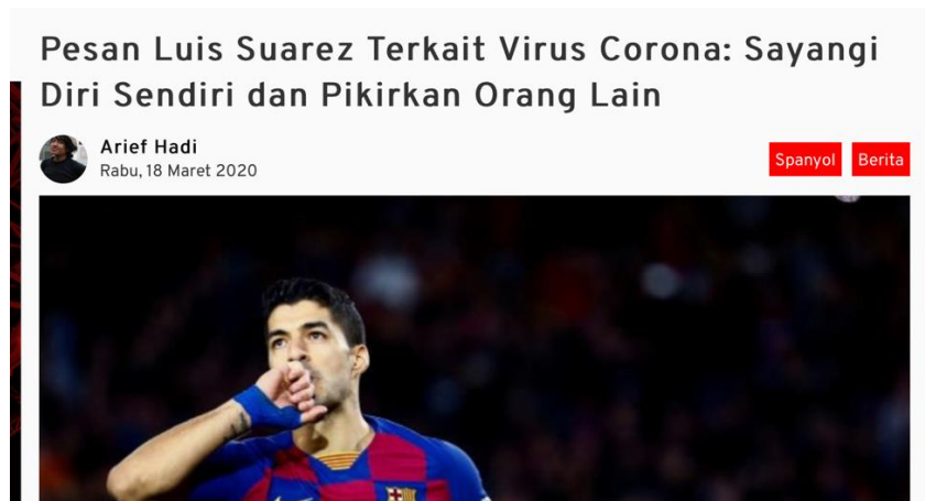
Gambar 3.2 Berita penulis tampak atas