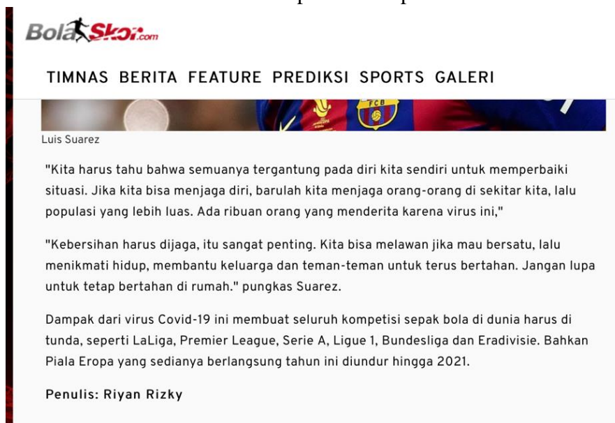
Gambar 3.3 Berita penulis tampak bawah