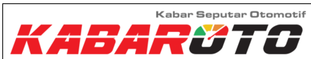
Gambar 2.4 Logo Kabaroto ( Media, 2019 )

Kabaroto memiliki ikon huruf O dengan logo speedometer . Desain tulisan kabaroto.com juga memiliki makna, tegas, aerodinamis. Arti tegas di sini yaitu berita berimbang yang dapat dipertanggung jawabkan. Sedangkan aerodinamis mempunyai arti penyajian berita di Kabaroto mengikuti perkembangan dengan gaya bahasa yang dipergunakan komunitas sehari-hari. Pada Gambar 2.4 menunjukkan logo dari media Kabaroto.com.