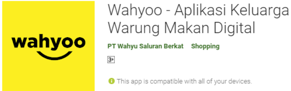
Gambar 2.4 Aplikasi Wahyoo

Pada gambar 2.4 dapat di katakan bahwa PT Wahyu Saluran Berkan membuat sebuah aplikasi yang digunakan untuk mempermudah para mitra warung makan untuk melakukan pembelian bahan – bahan pangan, agar dapat melakukan pengiriman secara lebih cepat dengan penerapan sistem one day delivery , atau besok sampai.