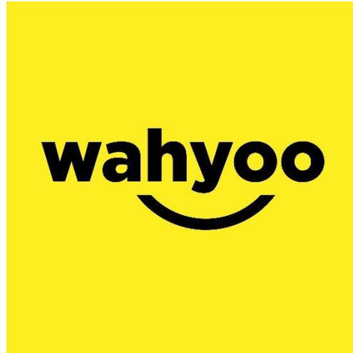
Gambar 2.1 Logo Wahyoo

Gambar 2.1 merupakan logo dari perusahaan PT Wahyoo Saluran Berkat atau yang lebih di kenal dengan wahyoo, wahyoo merupakan sebuah perusahaan startup yang bergerak di bidang teknologi dengan tujuan untuk memberikan nilai tambah dan bermanfaat bagi warung – warung di Indonesia.. Jika di ambil dari artikel wahyoo adalah perusahaan teknologi yang hadir untuk membantu para pemilik warung makan di Indonesia agar lebih professional dan sukses dalam menjalankan usaha warung makan yang mereka miliki. (Akbar, 2019)