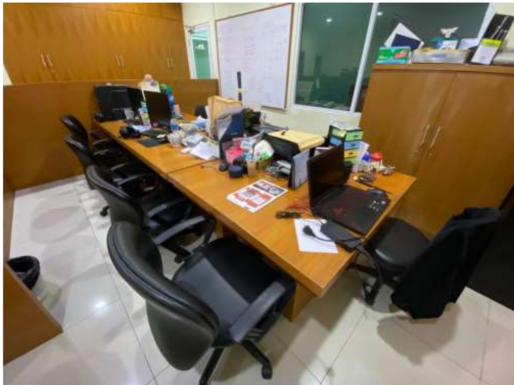
Gambar 2.3. Ruang Kerja Media (Dokumentasi Penulis)

Berikut ini adalah tampilan kantor magang penulis: