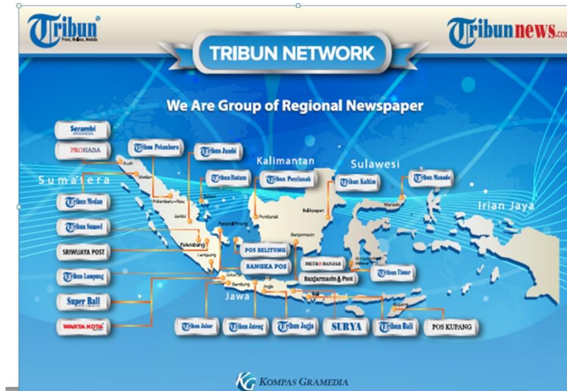
Gambar 2.2 Tribun Network