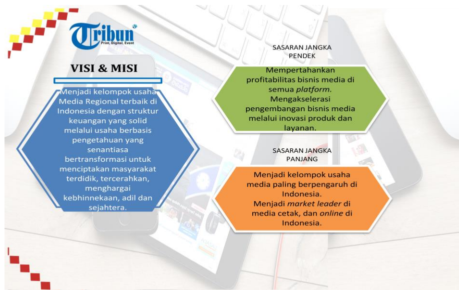
Gambar 2.3 Visi dan Misi Tribun

Sasaran jangka pendek mempertahankan profitabilitas bisnis media di semua platform . Mengakselerasi pengembangan bisnis media melalui inovasi produk dan layanan. Sasaran jangka panjang menjadi kelompok usaha media paling berpengaruh di Indonesia. Menjadi Market Leader di media cetak, dan online di Indonesia. (Tribunnews. 2019)