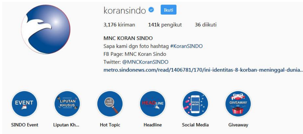
Gambar 2.4 Instagram Koran Sindo