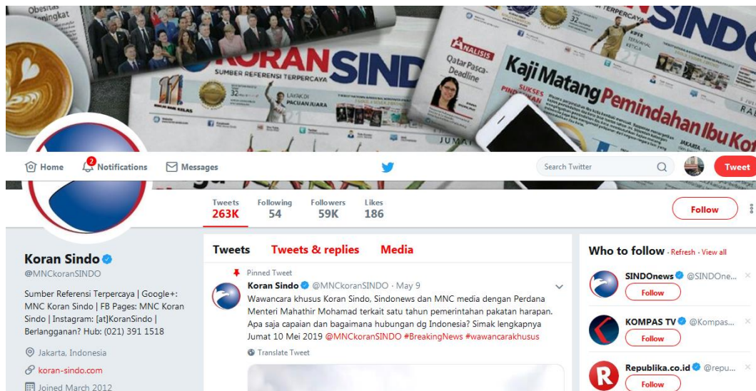
Gambar 2.3 Twitter Koran Sindo

Didapatkan dari https://twitter.com/mnckoransindo