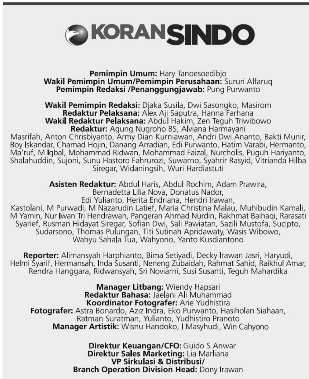
Gambar 2.7 Tim Redaksi Koran Sindo