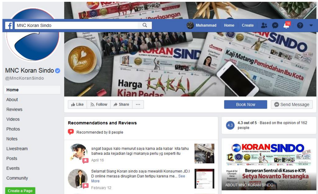
Gambar 2.2 Facebook Koran Sindo