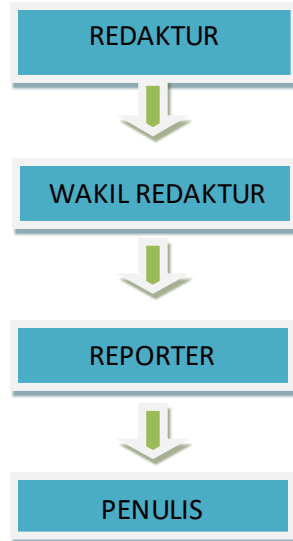
Gambar 2.5 Struktur Magang Divisi lifestyle

Lifestyle sendiri merupakan rubrik yang memiliki jumlah halaman yang paling banyak di Koran Sindo. Dikarenakan banyaknya sub rubrik yang ada. Kemudian, dari sisi tim Redaksi divisi lifestyle terdapat beberapa bagian, yakni Redaktur, Wakil Redaktur, Reporter, Fotografer, Korensponden daerah dan Editor Bahasa. Sedangkan, kalau untuk magang berbeda pula bagian-bagian, cenderung lebih sedikit, seperti tabel di bawah ini