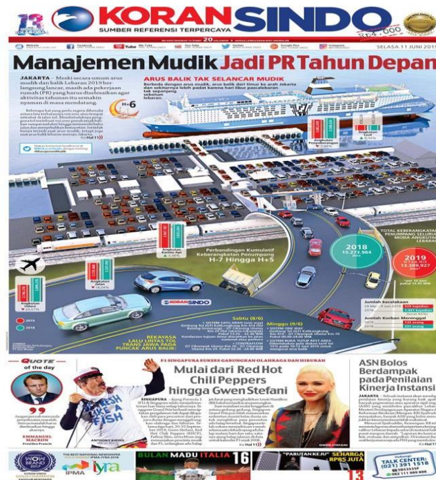
Gambar 2.1 Halaman Utama Koran Sindo