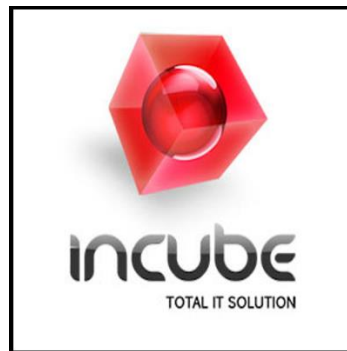
Gambar 2.1 Logo Incube Solutions

Berikut gambaran mengenai logo perusahaan Incube Solutions.