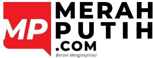
Gambar 2.3 Logo Merah Putih Media

Pada Gambar 2.3 dapat dilihat logo MerahPutih Media yang merupakan sebuah Produk Portal Berita dari PT MerahPutih Media yang sangat mengedepankan Informasi yang Faktual sebagai pedoman dalam membuat sebuah Berita. Dalam mengedepankan hal tersebut PT MerahPutih Media memiliki beberapa Kategori yang sedang dikerjakan dan sedang dilakukan saat ini.