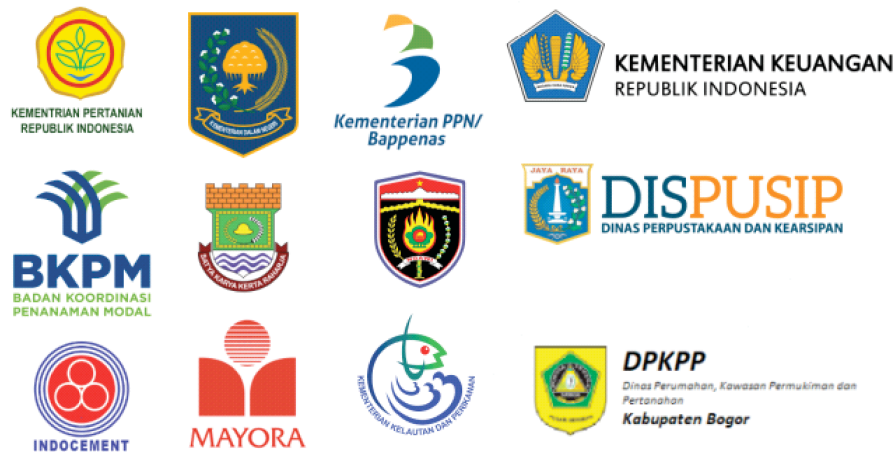
Gambar 2. 4. Kementrian dan BUMN