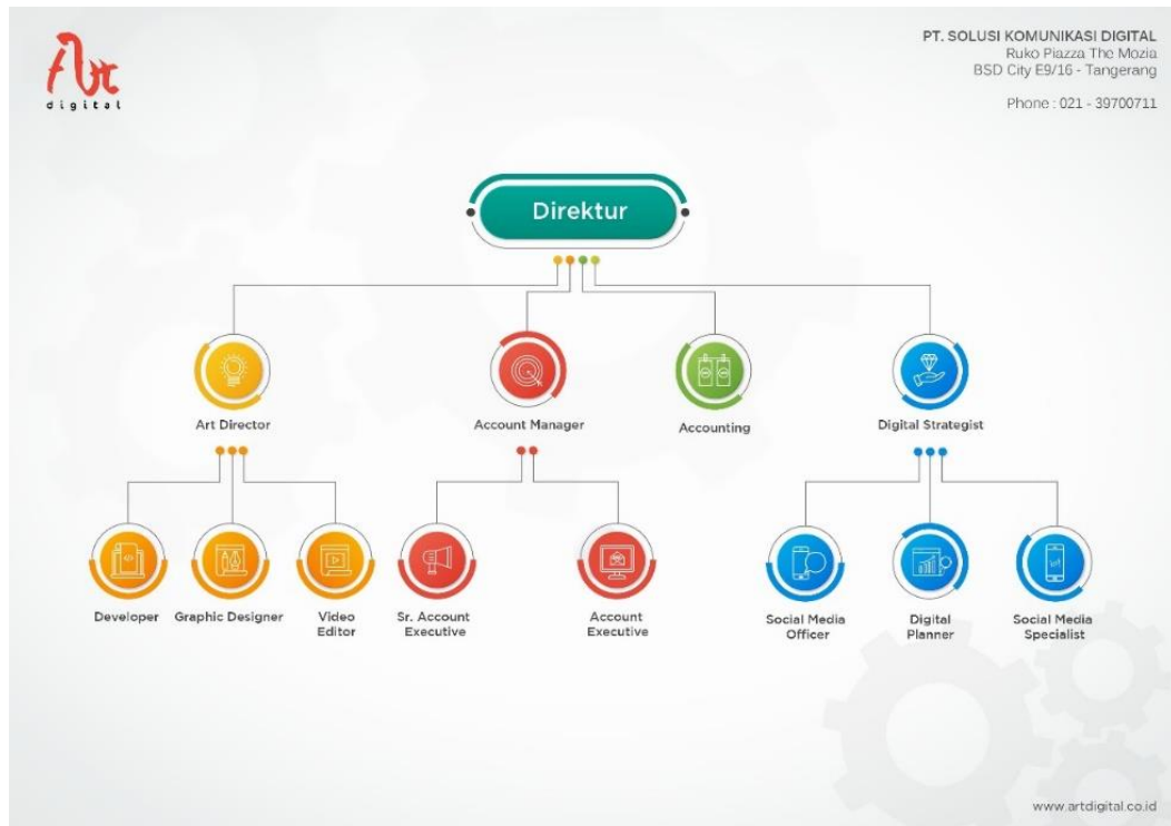
Gambar 2.3. Bentuk struktur organisasi dari ART Digital (PT. Seni Kreasi Digital, 2020)

Dalam struktur organisasi PT. Seni Kreasi Digital, setiap peran memiliki tanggung jawabnya masing-masing dalam mengerjakan setiap tugas bagiannya. Posisi yang penulis dapatkan ialah peran dalam tim Graphic Designer yang dipimpin oleh Art Director yang juga hadir sebagai supervisor atau pembimbing lapangan.