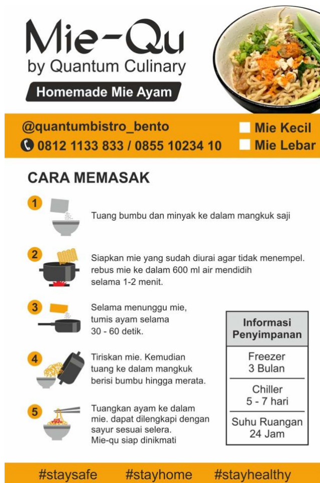
Gambar 2.2. Sticker dan Tata Cara Penyajian Mie Qu

PT.Sumber Print telah menghasilkan beberapa desain-desain untuk client. Proyek-proyek yang telah diselesaikan oleh PT. Sumber Print Indonesia ini menunjukkan di bidang percetakan.