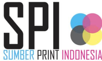
Gambar 2.1. Logo PT. Sumber Print Indonesia

Nama PT. Sumber Print Indonesia diambil dari kata sumber segala percetakan yang diartikan menyediakan percetakan jenis media cetak apa saja termasuk laminating.