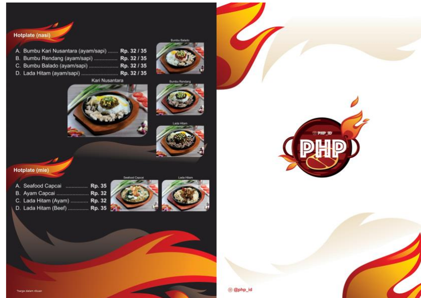
Gambar 2.4. Buku Menu PHP(PondokHotPlate)

beverages , PT. Sumber Print Indonesia juga bertanggungjawab atas perancangan identitas visual PHP (PondokHotPlate) sebuah restaurant hotplate yang berada di daerah Jakarta Barat, Taman Semanan Indah. Makanan khas Indonesia dan western yang menggunakan bahan-bahan alami dan fresh .