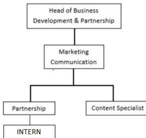
Gambar 2.3 Struktur Tim Marketing

Saat ini struktur organisasi dari Codify.id memiliki alur yaitu para Specialists melapor pekerjaan kepada Head of Marketing Communication , setelah itu Head of Marketing Communication melapor kepada Product Manager of LINIPOIN , dalam divisi marketing terdiri dari satu Head dan Specialists , yang dibantu oleh intern .